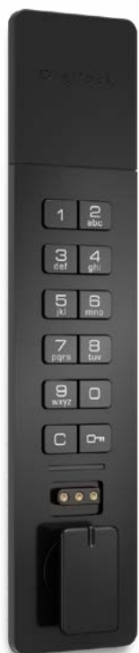
Hybride à montage encastré Bouton en bas

Choisissez entre les finitions nickel brossé et noir mat.