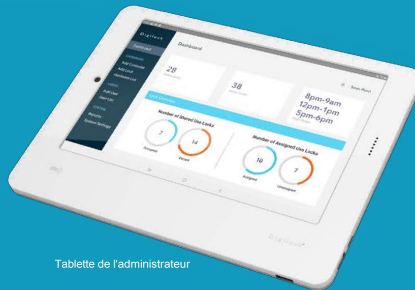
Tablette de l'administrateur

Voici DigiLink, la dernière avancée de Digilock en matière de systèmes de gestion de réseau. S'appuyant sur notre héritage en matière de stockage personnel sécurisé, DigiLink vous permet de gérer vos installations et vos utilisateurs depuis n'importe où, vous donnant ainsi les outils dont vous avez besoin pour assurer la sécurité de votre organisation.