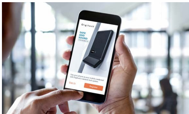
Application pour téléphone intelligent de l'utilisateur final