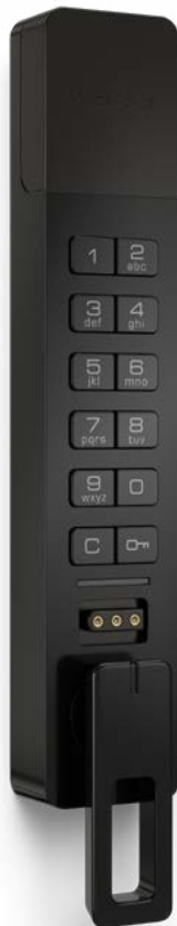
Montage en surface Hybride ADA Bouton en bas