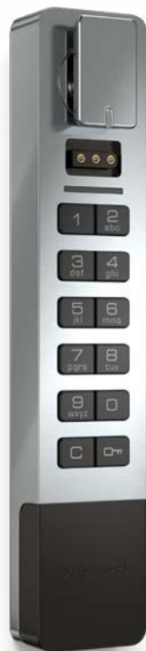
Montage en surface Hybride Bouton sur le dessus

Montage en surface Hybride Bouton à gauche